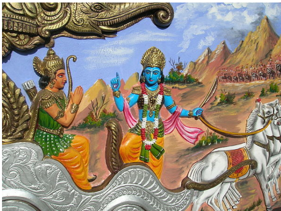
Arjuna y Kkrishna en la batalla de Kuruksetra del Bhagavad-guita: simbólica alegoría del combate interior en el asceta místico.

En el budismo mahayana se destaca la figura del Bodhisattwa , aquél que disolviendo su propio “yo ilusorio” y encontrándose a las puertas de la dicha del nirvana, renuncia a estos por compasión, para seguir ayudando espiritualmente a todos los seres humanos sufrientes a su propio despertar y liberación. [49][50][51]