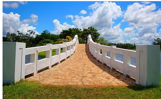
La muerte mística, puente espiritual común en las diversas tradiciones religiosas que conduce a la vivencial experiencia de la unidad transcendente.

En las Upanisad , en el marco del brahmanismo —religión de la antigua India considerada el nexo entre el periodo védico (del 1500 al 600 a.e.c.) y el hinduismo posterior—, ya se señalaba la necesidad de la aniquilación del yo para reintegrarse en el Todo. [54]